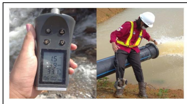
Gambar 1. Pengukuran debit aktual pompa

Perhitungan debit aktual dari pompa, diperlukan agar peneliti mengetahui seberapa besar debit air yang dikeluarkan oleh pompa secara aktual melalui outlet dari pipa, yang mana merupakan salah satu item data yang diperlukan guna mengevaluasi dari kinerja pompa di sump T1 utara. Saat pengukuran, peneliti tidak perlu menghitung kecepatan secara manual dapat dilihat pada tabel 6, karena sudah menggunakan alat current water meter yang dapat dilihat pada gambar 1.